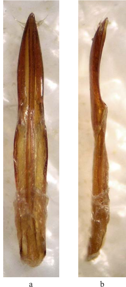
Fig. 3.—Edeago del ♂ lectotipo de Asida abrupta , vistas dorsal (a) y lateral (b).

El dimorfismo sexual es importante, las hembras (Fig. 4) son más anchas y ovales, más convexas en general, con la escultura costal menos señalada que en los machos y, en particular, de talla notablemente superior (Las dimensiones medias en las hembras son 11,06 x 5,62 mm y en los machos 9,3 x 4,06 mm).