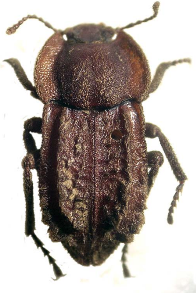
Fig. 2.—Habitus del ♂ lectotipo de Asida abrupta . Fig. 2.—Habitus of the ♂ lectotypus of Asida abrupta .

Los restantes seis ejemplares identificados de esta especie están reseñados como 'material adicional', excluidos de la serie típica. En efecto, uno de ellos, perteneciente a la colección Oberthür, porta la indicación de haber sido colectado en Bône, mientras que los otros cinco, procedentes de las colecciones de Allard, Oberthür, Ardoin y Bonvouloir, no portan mención de la localidad de captura.