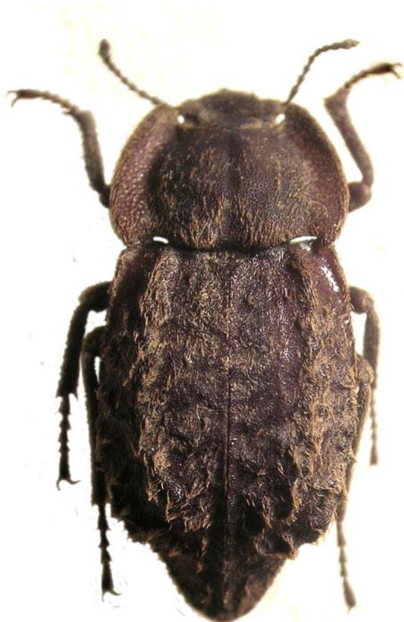
Fig. 4.—Habitus de una ♀ paralectotipo de Asida abrupta .