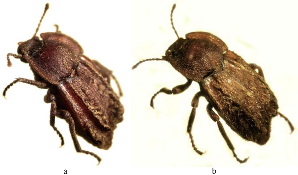
Fig. 6.—a) Vista en \frac{3}{4} de Asida abrupta ; b) Vista en \frac{3}{4} de Asida inaequalis . Fig. 6.—a) \frac{3}{4} view of Asida abrupta ; b) \frac{3}{4} view of Asida inaequalis .